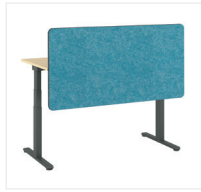
Sichtschutz oberhalb des Tisches/Sichtschutz mit Blende