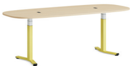
Migration SE Höhenverstellbarer Besprechungstisch mit T-Fußgestell

Der höhenverstellbare Besprechungstisch Migration SE ermöglicht den Nutzer*innen, ihre Körperhaltung ganz einfach per Knopfdruck zu ändern. Meetings werden flexibler, was wiederum die Produktivität steigert. Der Tisch kann in vielen verschiedenen Settings genutzt werden, von Teambereichen über Zonen für Kleingruppen bis hin zu Besprechungsbereichen. Die Settings können entsprechend der jeweiligen Bedürfnisse des Teams angepasst werden - auf Knopfdruck wird aus einem traditionellen Besprechungszimmer ein Ort für Stand Up-Meetings oder flexible Brainstorming Sessions.