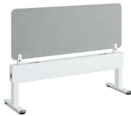
Migration SE Freistehender Fence