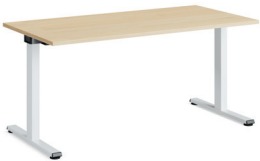
Migration SE Freistehender Tisch

Die höhenverstellbaren Schreibtische und Benches von Migration SE bieten langfristige Flexibilität, denn die Benchkonfigurationen können wieder in Tische aufgeteilt werden und umgekehrt. Tische in starrer Höhe können mit nur wenigen zusätzlichen Teilen zu höhenverstellbaren Tischen angepasst werden.