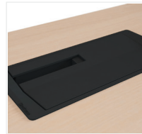
Plattenbündige Kabeldose aus Kunststoff