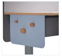
Seitliche Blende mit Holzknöpfen*