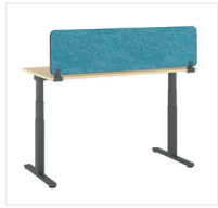
Sichtschutz oberhalb des Tisches

Divisio und Partito Screens und Paneele in verschiedenen Konfigurationen können als Sichtschutz oder Blenden zum Einsatz kommen. Das Paneel aus Stahl mit Blende sowie das seitliche Paneel aus Stahl mit Blende sind exklusiv nur für Migration SE erhältlich.