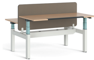
Migration SE Bench in H-Form