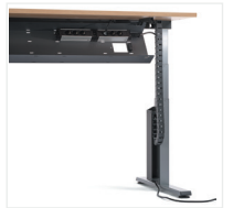
Kabelkanal und -kette