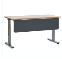
Blende aus Stahl