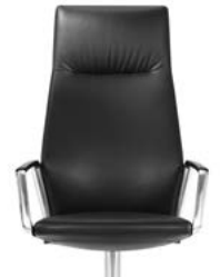
_2 Rücken Polster Hoch Dossier haut rembourré